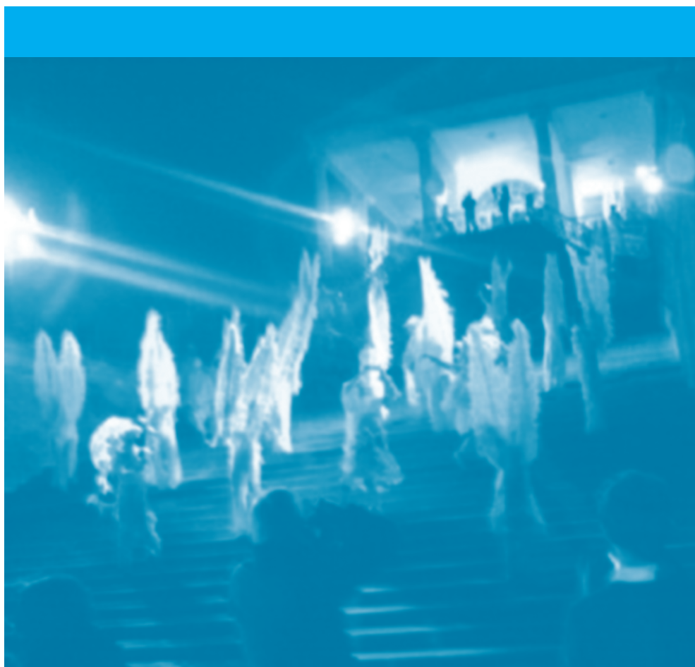
Cerimonia finale del G8 a San Pietroburgo (Russia), 2006.

L'incontro favorisce anche una conoscenza dell'altro, della sua storia, del suo Paese e della sua cultura cosa che è decisamente uno degli aspetti più importanti del G8 Junior