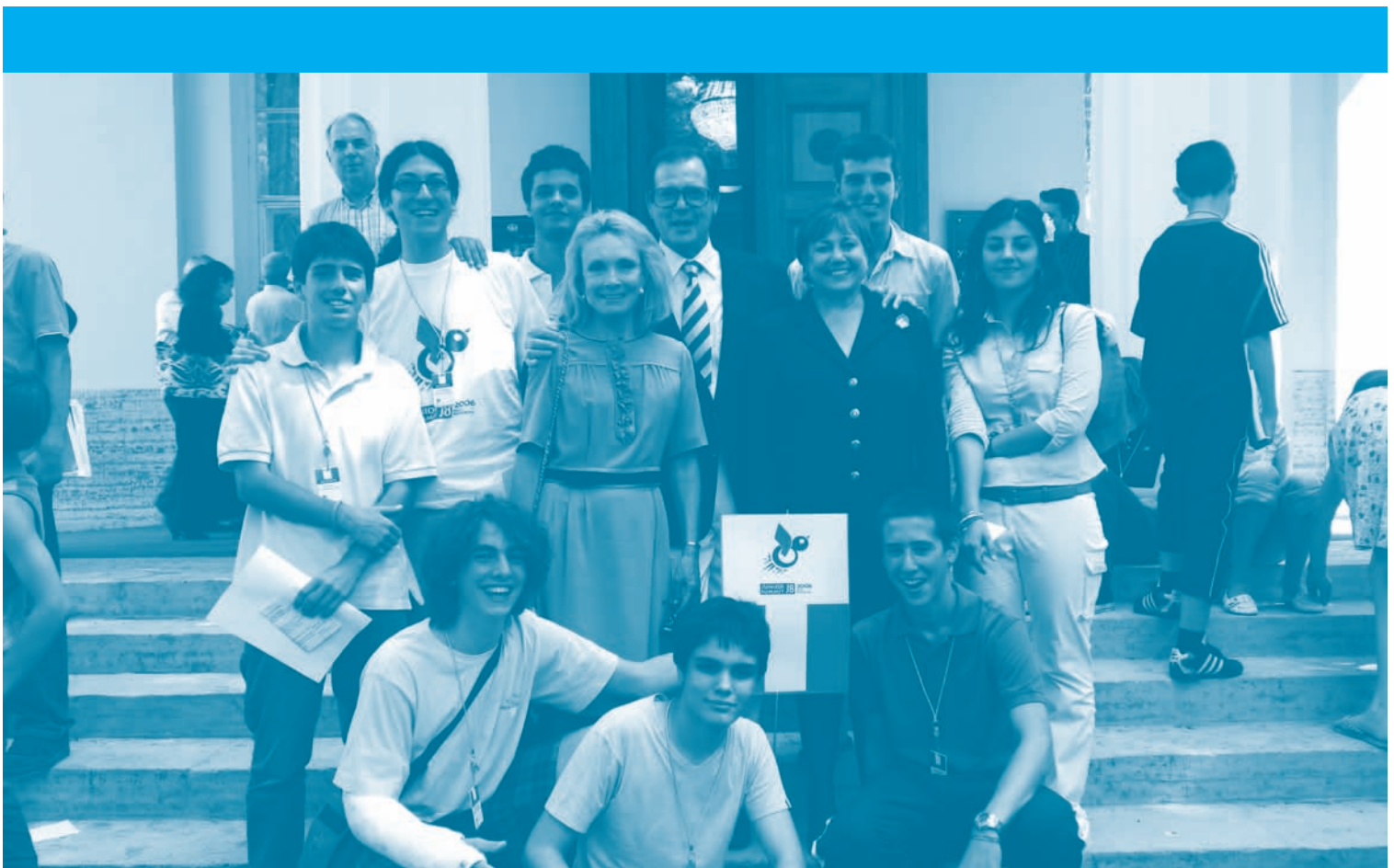
Il gruppo dei ragazzi italiani con Roger Moore (Ambasciatore UNICEF) a Chitose (Giappone), 2008.

■ la promozione di una cultura della partecipazione che coinvolga i giovani